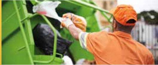
Huisvuilophaling gewikt en gewogen (p.2)