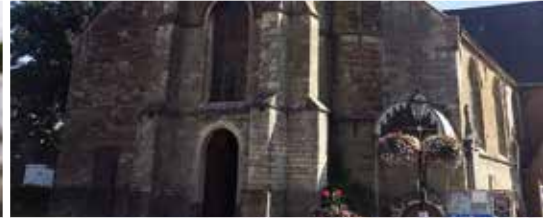
Herbestemming van onze kerken (p.3)