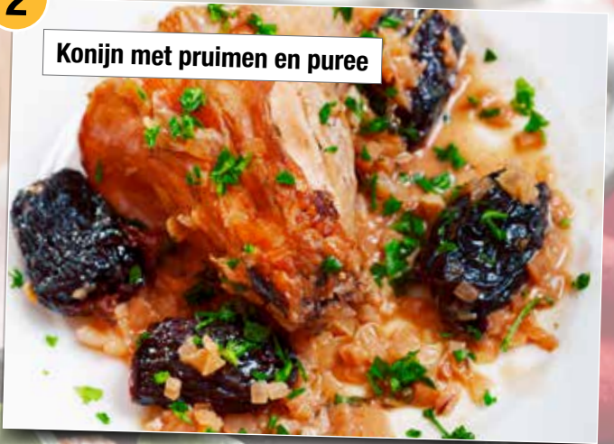
Konijn met pruimen en puree