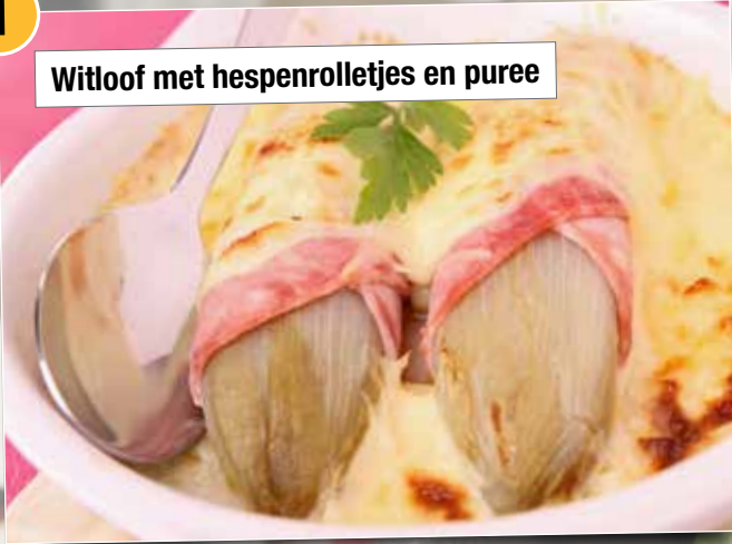
Witloof met hespenrolletjes en puree