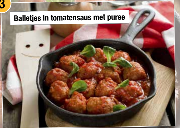
Balletjes in tomatensaus met puree